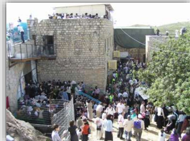
מתחם קבר רבי שמעון בר יוחאי במירון בל"ג בעומר צילום: יונתן שטיין, 2006