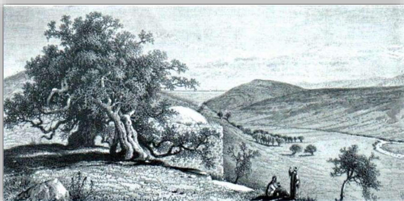
עץ עתיק ליד מקאם בעמק האלה איור: וילסון, 1880

עצים קדושים הם אלו המשמשים כמושא לפולחן וסגידה. תהליכי פיתוח, נטישת כפרים במלחמת העצמאות והחלשות מסורות ישנות מצמצמים את מספר העצים ה"פעילים", שעדיין עולים אליהם מאמינים. איסור חברתי ותרבותי חמור שחל על פגיעה בהם, שמר עליהם ואפשר את התחדשותם משך מאות שנים.