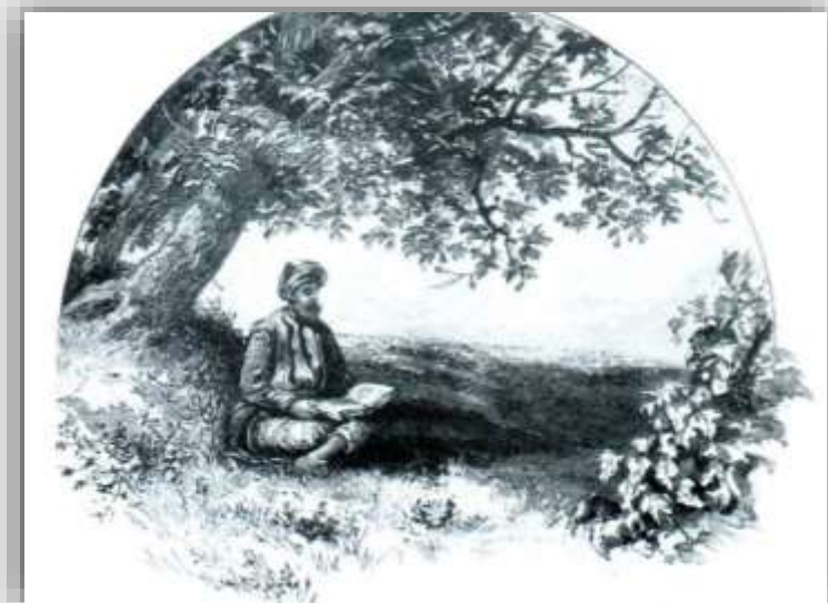
צדיק בצל עץ מקודש איור: Geikie, 1896

"עצי מורשת" הם בעיקר עצים שעונים על אחת מהגדרות הבאות: עצים ותיקים שניטעו לפני קום המדינה, עצים מיוחדים ונדירים, או עצים הקדושים לפחות לאחת מהדתות המונותאיסטיות. מנתוני הסקר אפשר ללמוד שכ-20% מהעצים הם בני יותר ממאה שנה. העצים, שגילם הוערך ביותר ממאה שנים, הם כולם מהמינים: אלון מצוי, אלה אטלנטית, אלון התבור, איקליפטוס המקור, שיזף מצוי, חרוב מצוי, פיקוס השקמה, וברוש מצוי.