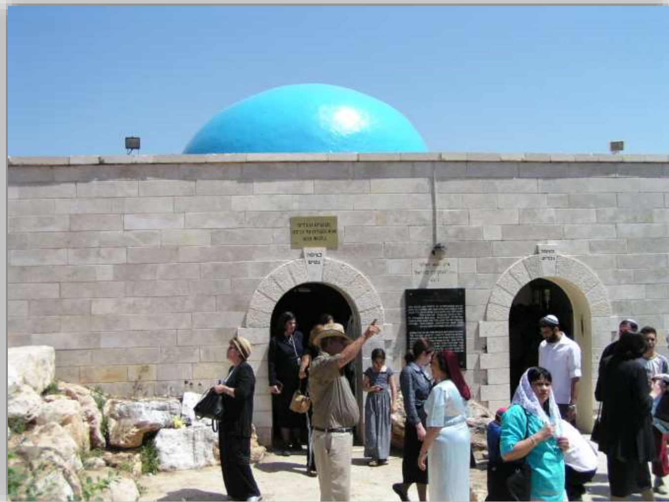
הכניסה לקבר התנא יונתן בן עוזיאל

בעמוקה ליד קבר התנא יונתן בן עוזיאל, הגדול בתלמידי הלל הזקן, נמצאת אלה ארצישראלית גדולה ועתיקה שלענפיה קשורים מאות בדים, ביטוי לאמונה עממית שעל כל המבקש בקשה על הקבר ומעוניין שייענה, לקשור חלק מבגדו לענפי העץ. ציון קברו של התנא יונתן בן עוזיאל הינו מבנה אבן לבן בפאתי יער ביריה הצפוניים, בסמוך ליישוב עמוקה. לפי "המרכז הארצי לפיתוח מקומות קדושים", האתר מתועד כציון קבר כבר מהמאה ה-11 לסה"נ, וכיום הוא מושך אליו עולים רבים, בעיקר כמקום מיוחד לתפילה למציאת זיווג.