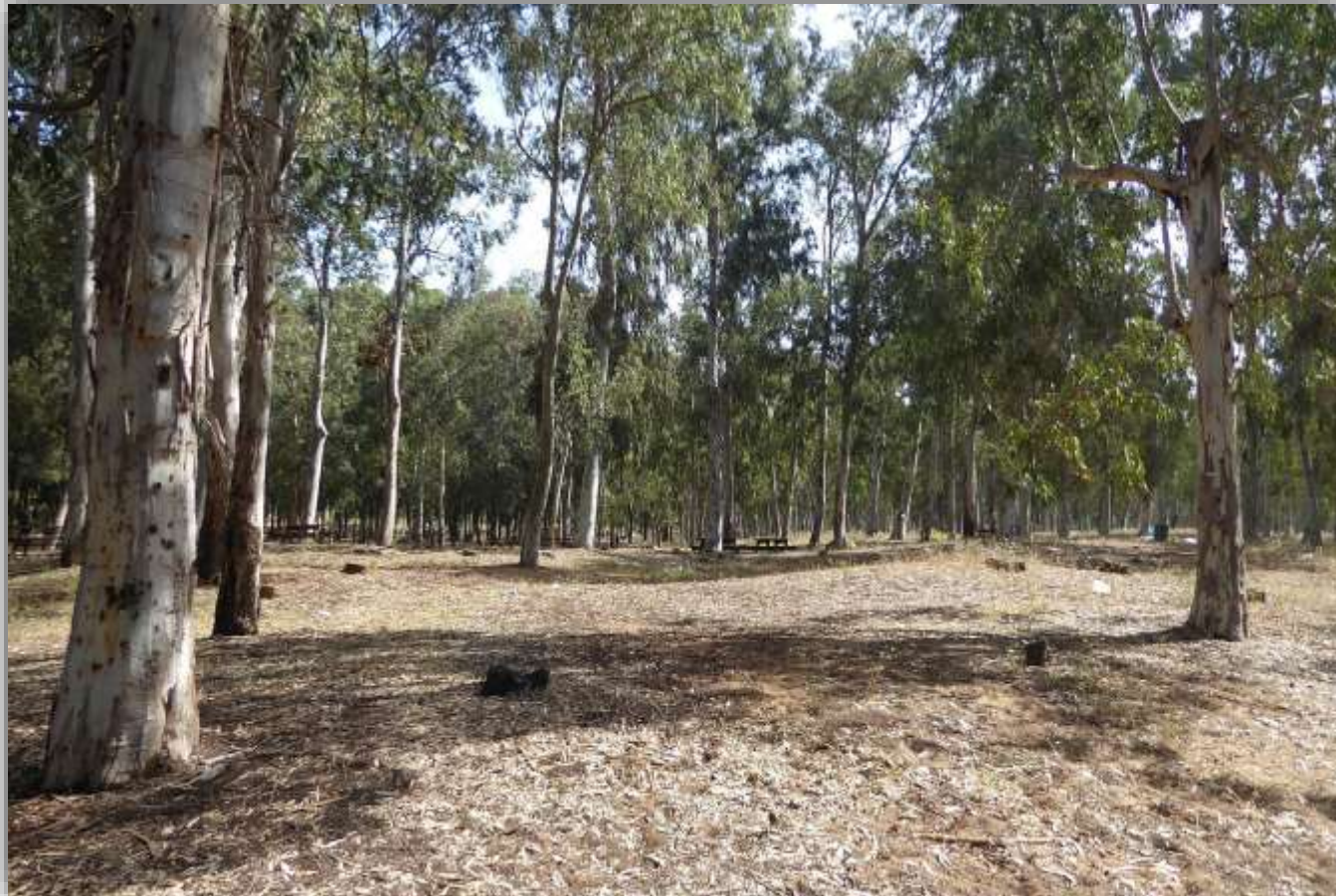
איקליפטוסים על גדות נחל אלכסנדר, 2016

בחלוף הזמן התברר שייבוש המים ביעילות בוצע באמצעות ניקוז מי הביצות אל הים ולא דווקא בעקבות נטיעת האיקליפטוסים. בכל מקרה, העץ הזה שליווה את ההתיישבות היהודית בכל חלקי הארץ, זכה בפי תושבי הארץ הערבים לכינוי "עץ היהודים".