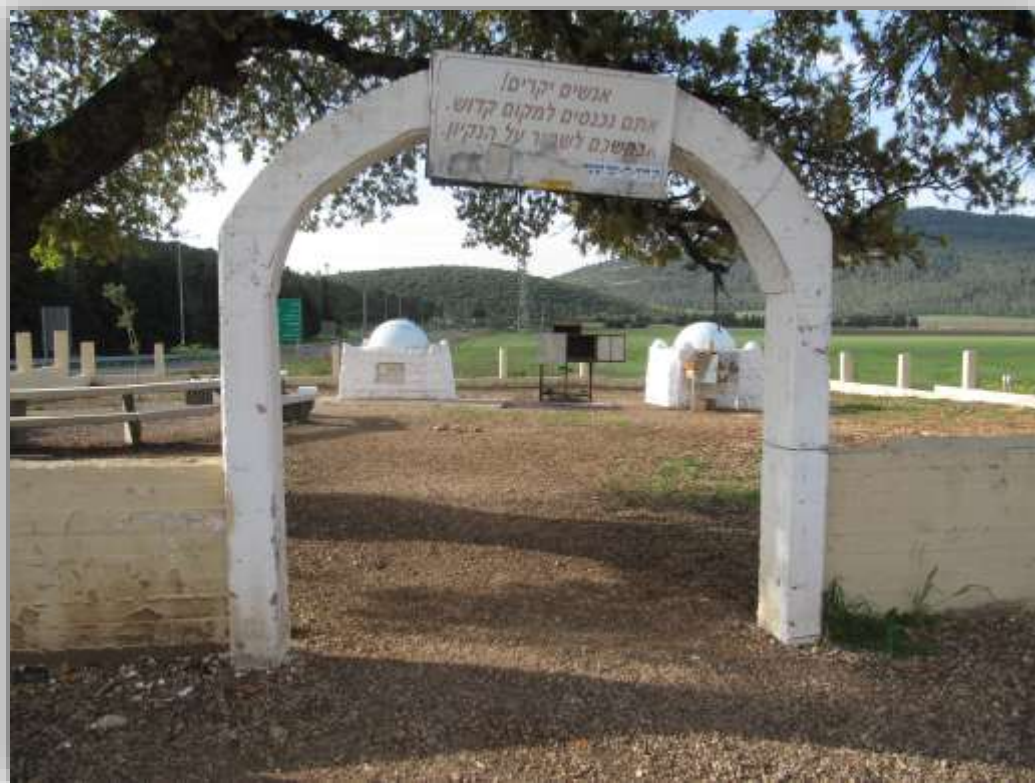
אתר קבר רבי חלפתא הגדר והמתקנים במתחם צילום: שבילים, 2013

שיקולים פוליטיים ודתיים מחד גיסא ובורות והתנשאות מצד הציבור החילוני מאידך גיסא, הביאו לכך שבפועל אנשי המקום והממסד הדתי מקבעים את דמותו של מקום קדוש לפי טעמים ויכולתם, ואין מי שימחה.